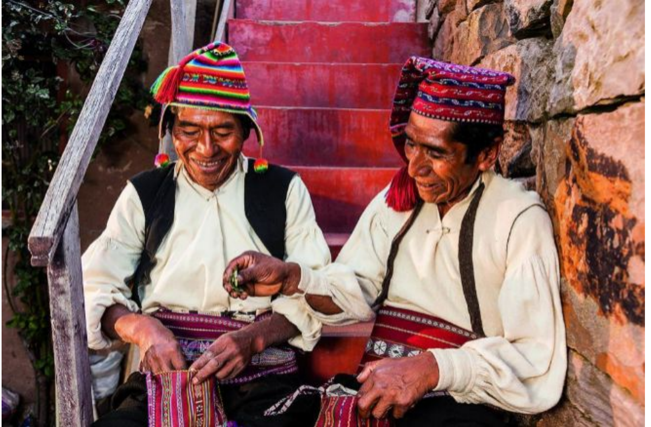
Perú, a través de sus tradiciones y su gastronomía.

5. Las 5 capitales europeas que más inversión atraen