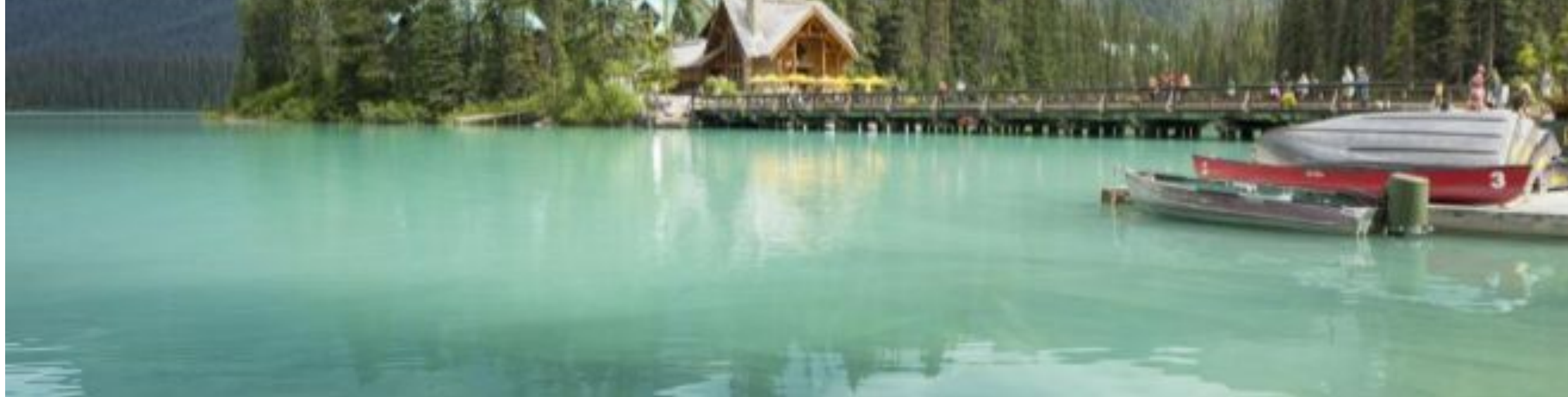
El lago Emerald está en el Yoho National Park de Canadá.

En una selección de escapadas navideñas siempre debe haber hueco para los clásicos: nieve y playa. En EXPANSIÓN le proponemos dos opciones en España, más accesibles si no dispone de muchos días libres o no quiere viajar tan lejos.