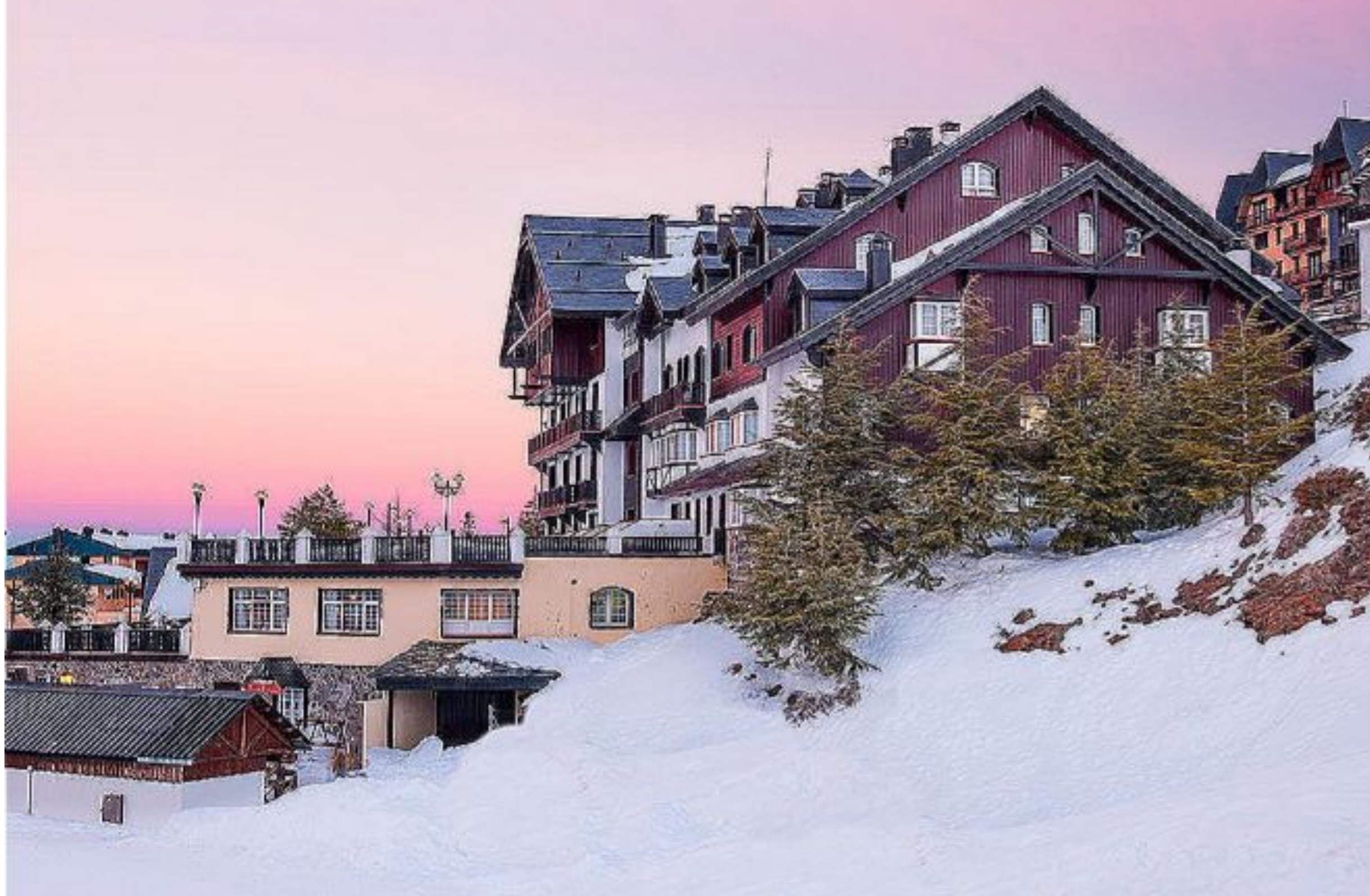
Vincci Selección Rumaykiyya está a pie de pista en Sierra Nevada.