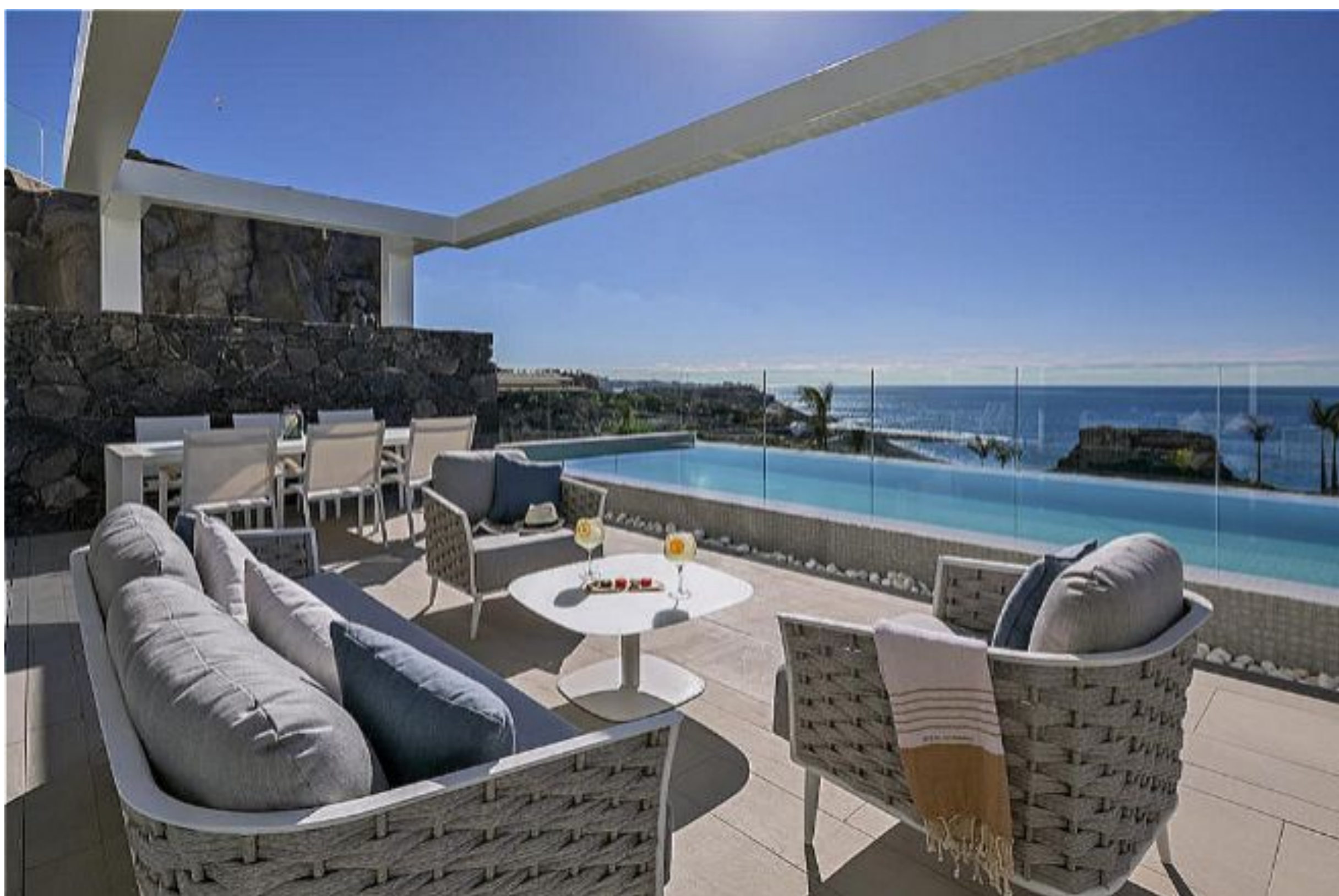
Royal Hideaway Corales Resort, ubicado en Costa Adeje, Tenerife.

Tenerife es siempre garantía de éxito en estas fechas del año por su buen clima. Elegido como "Mejor nuevo hotel de lujo de Europa 2018" en los World Luxury Hotel Awards, Royal Hideaway Corales Resort es un hotel de nueva construcción 5 estrellas Gran Lujo en Costa Adeje (Tenerife) con una oferta para familias y un área sólo para adultos. Los huéspedes podrán disfrutar de un masaje flotante con vistas al océano, sobrevolar el Teide desde un helicóptero o cenar en Maresía by Hermanos Padrón, el restaurante especializado en gastronomía canaria con una estrella Michelin.